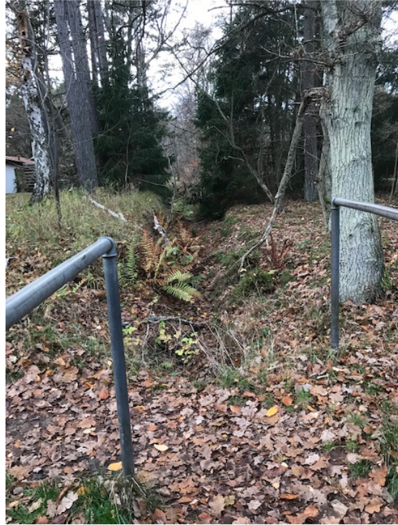
Intet vand. Tilgroet grøft