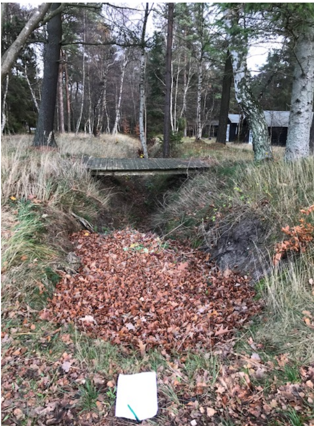
Intet vand. Haveaffald i grøft nærmest vej.