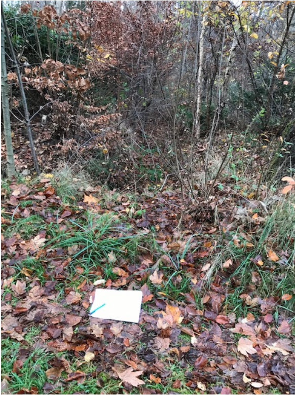
grøft ligefrem og mod venstre langs vej