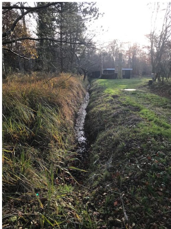
Vandspejl i grøften ud mod Arrenakkegrøften