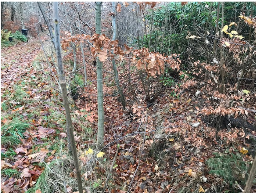
grøft langs Oskar Madsensvej set fra knækket.